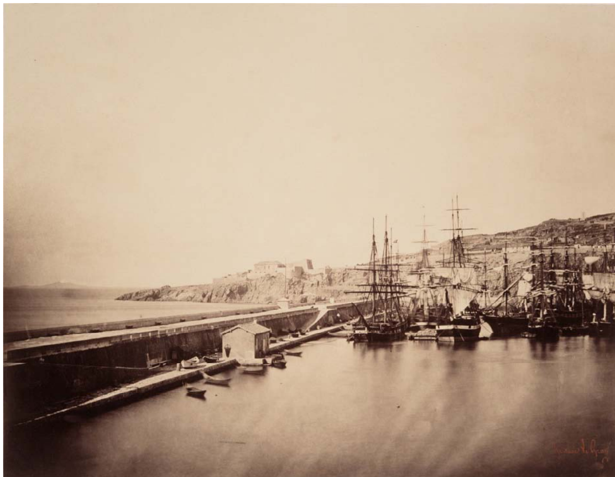
Gustave LE GRAY (1820-1884) Jetée de Cète [Sète] - Mer Méditerranée, 1857

Épreuve d'époque sur papier albuminé d'après négatif verre au collodion. Signature "Gustave Le Gray" à l'encre rouge apposée par un timbre humide sur l'image à l'angle inférieur droit. Partie du timbre sec ovale : "photographie Gustave Le Gray & Co", en bas, au centre du support de montage d'époque. Image : 31,1 x 40,4 cm. Support : 43,4 x 62,7 cm.